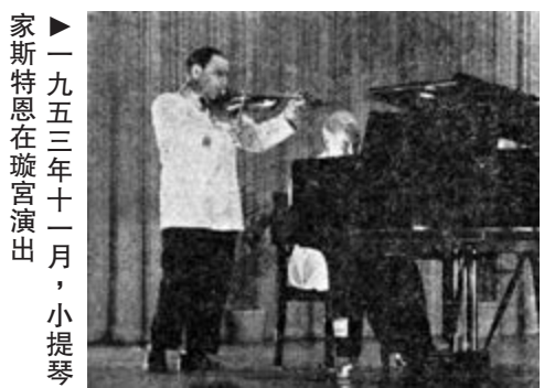
►一九五三年十一月，小提琴家斯特恩在璇宮戲院演出