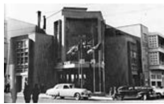
▲月園是集遊樂場、戲院及夜總會於一身的娛樂場所

月園在1949年底，由前中華民國國務總理許世英主持開幕，氣勢逼人。月園最初由郭春秧的繼承人郭雙鰲兄弟和英籍商人Charlie主理，但經營至1952年夏季，因虧蝕負債被香港法庭勒令停業；同年11月售予商人李世華，改名「大世界遊樂場」，後因虧損，於1954年7月結業，並把土地逐步改建成住宅出售，政府將附近一條掘頭巷命名為「月園街」，以作紀念樂園。