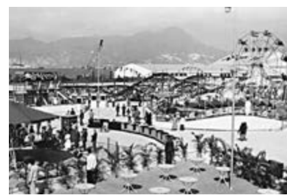
▲月園內有各種機動遊輪、火車、活龍車、摩托車、兒童遊等