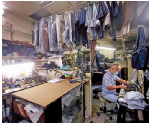
▲曾先生的洋服店在皇都商場開業逾半世紀