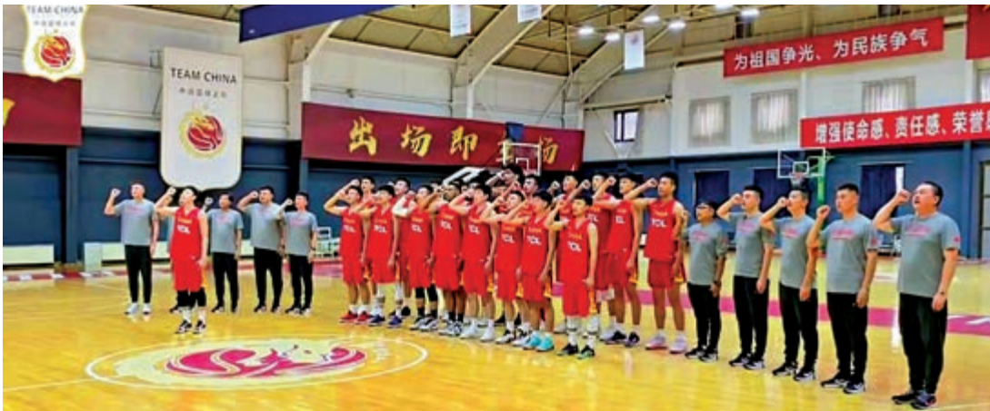
國籃全隊在開操前誓師