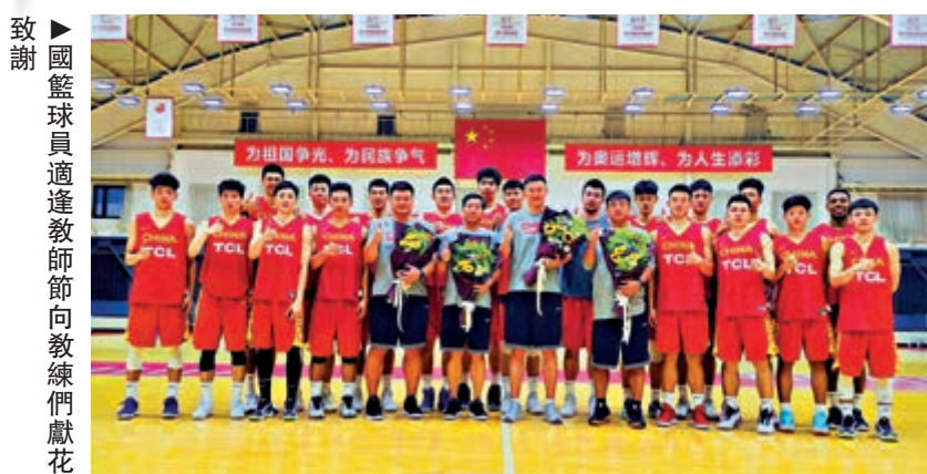
致謝 國籃球員適逢教師節向教練們獻花