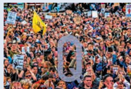
▲「Q粉」在倫敦特拉法加廣場高舉「Q」標識