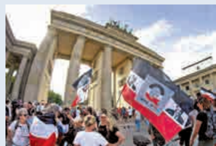
▲「Q粉」舉着特朗普旗幟在德國柏林勃蘭登堡門前參加集會

不只是右派，曾經是民粹主義政黨「五星運動」成員、現為意大利議會獨立議員的庫尼亞爾，5月也在會議上聲稱，微軟公司創辦人蓋茨在背後推動疫苗運動，目的在於「絕對支配人類，要他們淪為白老鼠和奴隸」，與「匿名者Q」思想契合，她還呼籲逮捕蓋茨。