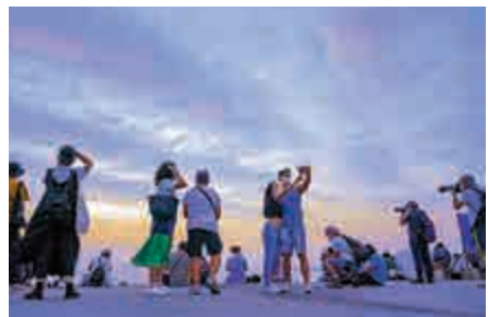
▲昨天周日天氣好，不少市民在碼頭欣賞日落，誰料到晚上掛一號波

根據天文台統計，香港在十月仍會受熱帶氣旋影響，是七至九月的打風「旺季」外，受影響最多的一個月份。