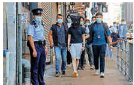
▲探員昨天帶同23歲疑犯，到酒吧附近進行案件重組

昨早10時許，警方封鎖柯士甸道金門商業大廈一間酒吧附近，並帶23歲疑犯進行案件重組，疑犯以黑布蒙頭