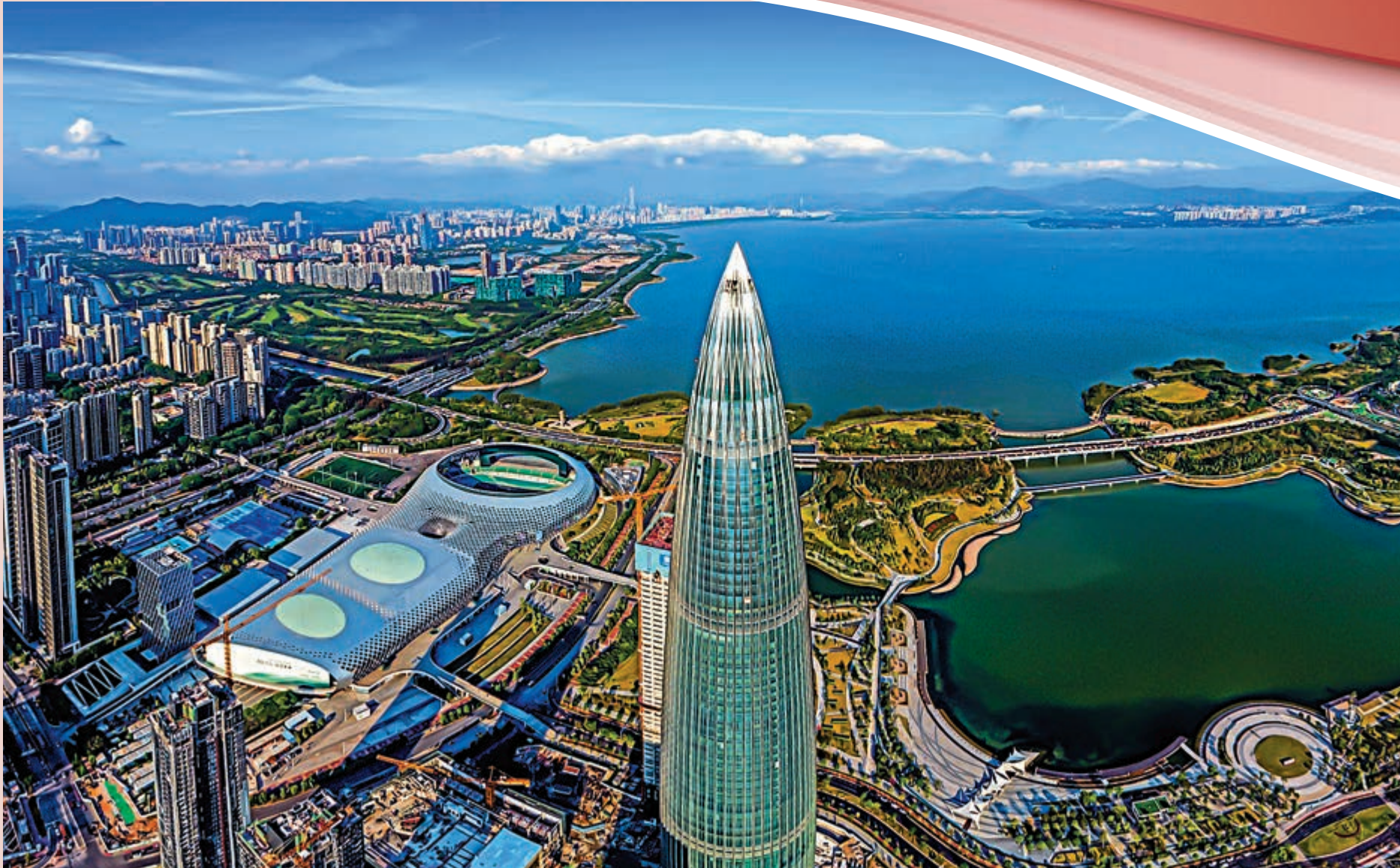
►深圳去年高新技術產業產值達26萬億元人民幣。圖為集聚多家高新科技企業的深圳市南山區

2013年以來，深圳前海累計新增註冊企業17.3萬家，企業年增加值增至2288億元，年稅收超428億元，今年上半年進出口總額逆勢增長21.4%