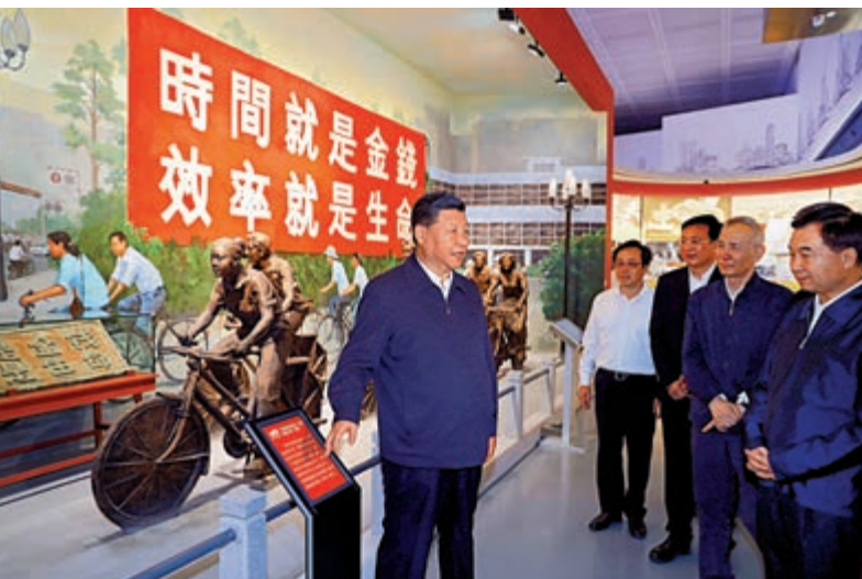
▲2018年10月24日，習近平在深圳改革開展覽館參觀「大潮起珠江——廣東改革開放40周年展覽」

站在更高起點上，向科技創新「無人區」進發，回答好一個個時代之問，是深圳建設先行示範區的「重中之重」。