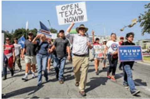
▲特朗普支持者10日參加得州的反封城示威

在威斯康星州，當局正準備在露天市場搭建野戰醫院。州長埃夫斯本周致信國會求援，表示威斯居民正在困境中掙扎。