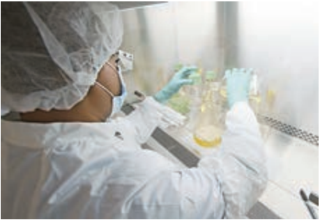
▲禮來公司的抗體藥物試驗因安全隱患暫停 美聯社

據《華爾街日報》介紹，禮來公司8月啟動LY-CoV555抗體療法3期臨床試驗，並開始測試這種抗體藥物與吉利德公司的瑞德西韋結合使用，是否對已住