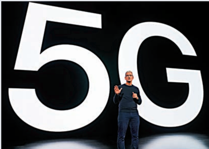
▲庫克在發布會上解釋5G技術的優勢