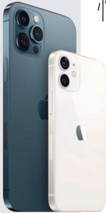
▲iPhone 12攝像功能獲升級

不過，和電香港行政總裁古星輝則認為，新iPhone手機將有助推動5G上客表現。隨着iPhone 12系列正式發布，和電旗下3香港特意新增5G月費計劃，除今年4月已推出的100GB及200GB兩項5G月費計劃，還將推出288港元30GB本地5G數據的新計劃。