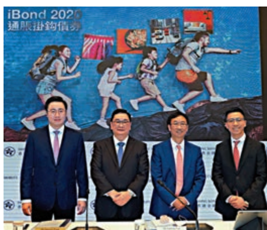
▲iBond保證回報2厘，回報非常吸引。圖為金管局月初公布詳情