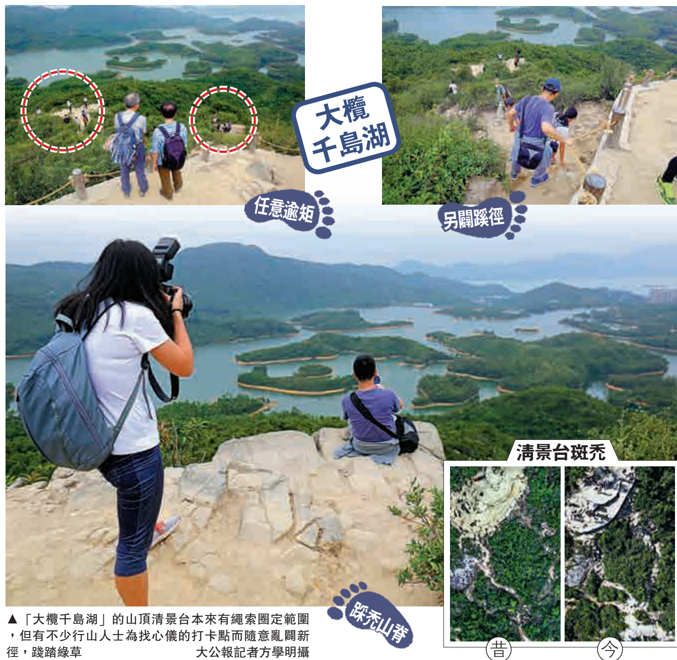
▲「大欖千島湖」的山頂清景台本來有繩索圍定範圍，但有不少行山人士為找心儀的打卡點而隨意亂闢新徑，踐踏綠草