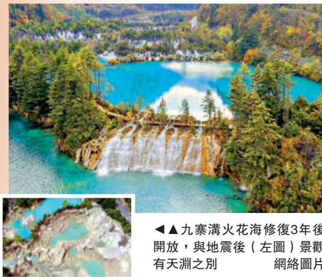
▲▲九寨溝火花海修復3年後開放，與地震後(左圖)景觀有天淵之別

「心心念念的火花海，終於又回來了。」10月24日，在四川九寨溝景區火花海景點，不少遊客在打卡拍照的同時，發出這樣的感嘆。