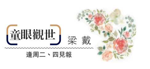
童眼觀世 梁戴 逢周二、四見報

近年科技公司已研發出可還原的程式，經過美圖的照片一按就還原，筆者比較厚道，明白愛美是人的天性，不想拆穿，但希望適可而止，不要太離譜。