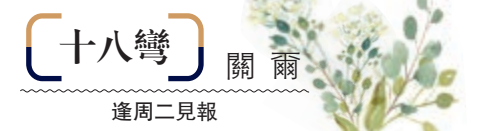
十八彎 關爾 逢周二見報

這種生生不息的「潮人精神」，在當今之動盪變局中，更顯彌足珍貴，更應弘揚禮讚。不忘中國心，方得中國興。