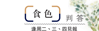
食色 判答 逢周二、三、四見報

酒味料理不少，但我始終最愛日本的酒饅頭，在點心界自成一格，常常要等到氣溫驟降時才不疾不徐地出場，不跟烈日炎炎搶風頭，卻能四兩撥千斤地贏得人心。實在地說，酒饅頭並不是只有一種，經典的包着紅豆餡。但更多亮點卻在外皮，用酒粕和糖、麵粉一起混合發酵，比普通饅頭多了嚼勁和麴的香甜，跟酒本身一樣，流動着平平無奇的誘惑，卻讓人不知不覺地上癮。而另外一種，則是戚風蛋糕的樣子，加入了酒的內涵。像福光屋的限量版酒饅頭，就使用了純米大吟釀，外表看上去像乳白色的蜂蜜蛋糕，沒有餡料，「小白兔」一般的單純，卻堪比大灰狼一樣的野心。撕開包裝那一瞬才露出真容，一股強烈的酒香撲面而來，簡直讓人未吃先醉。蛋糕體比起普通饅頭的外皮會更濕潤一些，整體融合度、口感都十分適宜，細細看去，蛋糕體內部會有微小的氣孔，貪婪地吸飽了酒粕精華。這也是為什麼有的人吃上它，一塊就微醺，不覺已沉浸。