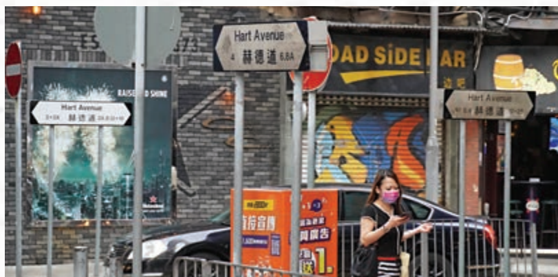
以赫德命名的赫德道，位於九龍尖沙咀