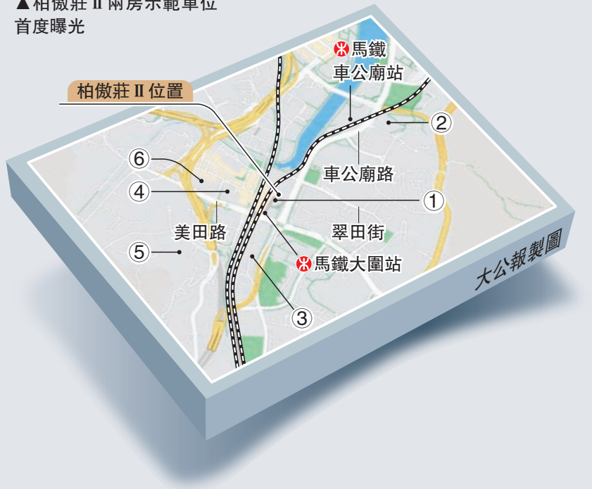
▲柏傲莊 II 兩房示範單位 首度曝光