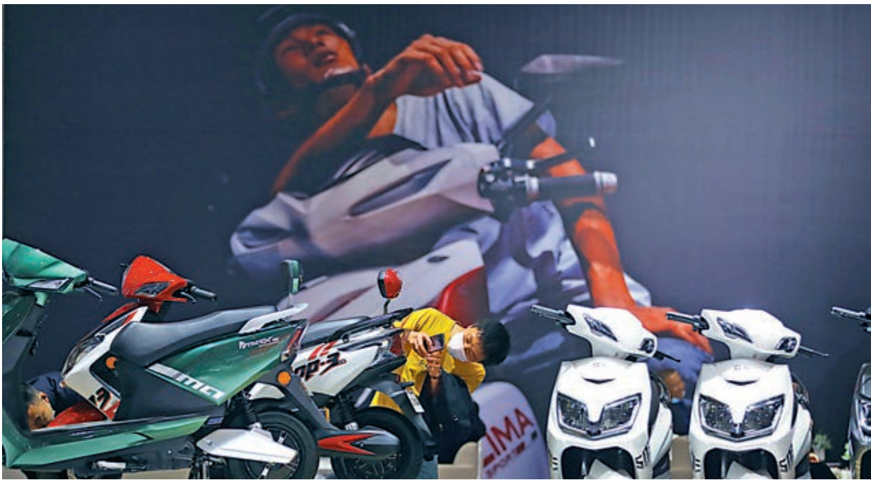
▲券商看好新能源、科技、國防軍工等領域的龍頭標的個股