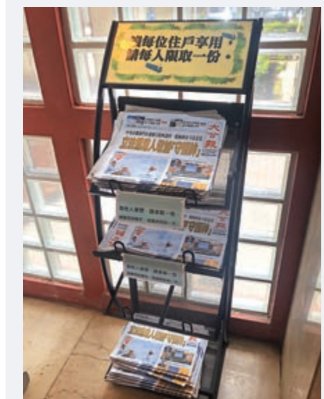
▲以往杏花邨「座頭」都有報紙架，供市民取閱《大公報》