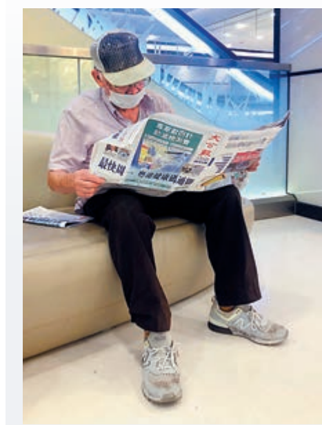
▲《大公報》是不少杏花邨居民每日的精神食糧