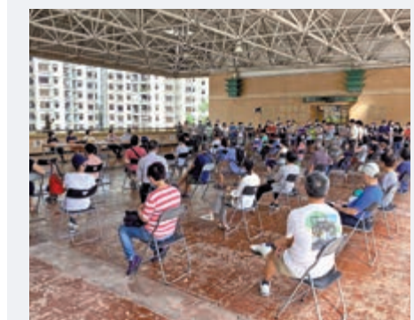
▲杏花邨七月初舉行兩場公聽會，但最後仍維持禁座頭擺報議決，居民直斥公聽會只是「做騷」