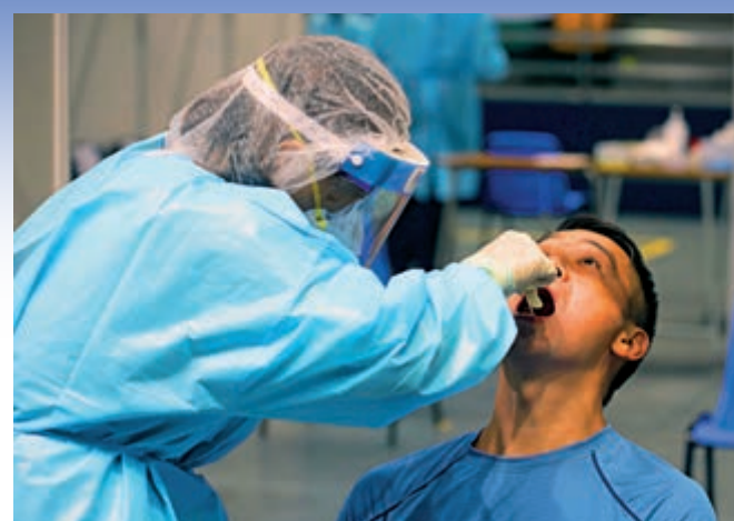
▲香港化驗師人手嚴重不足，私營市場出現高薪搶人