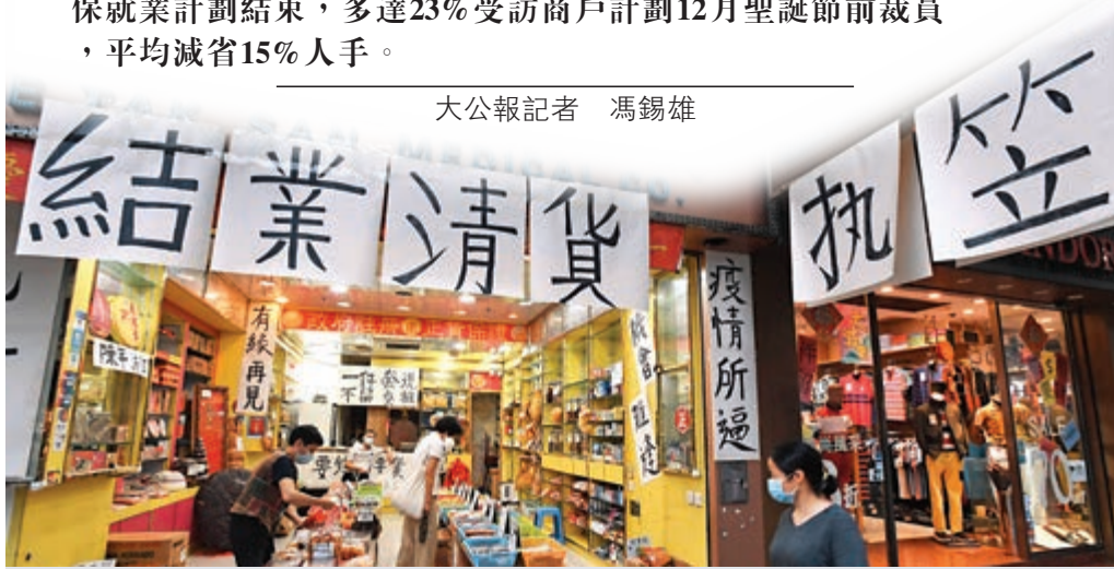
▲藥物及化妝品業銷貨額下跌百分之四十五點五，是跌幅最大的行業