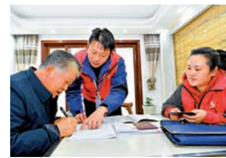
▲1日，湖北省襄陽市普查員、普查指導員在居民家中進行信息登記後，居民核實後簽字確認

中國的人口普查每10年開展一次。第七次全國人口普查從2020年11月1日到12月10日進行入戶登記，2021年4月開始陸續公布普查的主要數據。