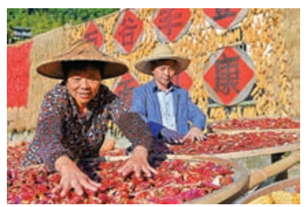
▲1日，福建三明桂峰村村民在整理曬區裏的農作物

中共中央政治局常委、國務院總理李克強作出批示指出，開展農村承包地確權登記頒證，是鞏固和完善農村基本經營制度的重要舉措。要鞏固並用好確權成果，不斷完善農村承包地所有權、承包權、經營權分置制度體系。