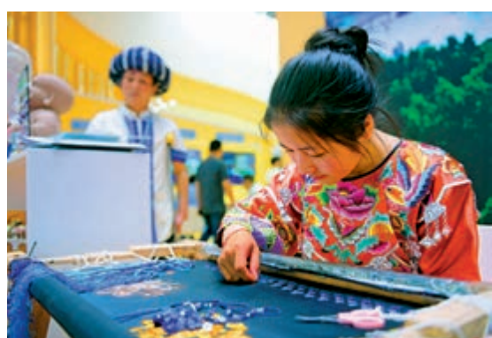
▲手工藝人展示夏布繡、苗繡等技藝，吸引觀眾的目光

握正確導向，自覺弘揚和踐行社會主義核心價值觀，樹立正確的歷史觀、民族觀、國家觀、文化觀，堅守中華文化立場，反映中國人民審美追求，維護國家文化安全和社會公共利益，維護社會公序良俗，積極履行社會責任和道德責任，創作生產更多健康向上、品質優良的文化產品。