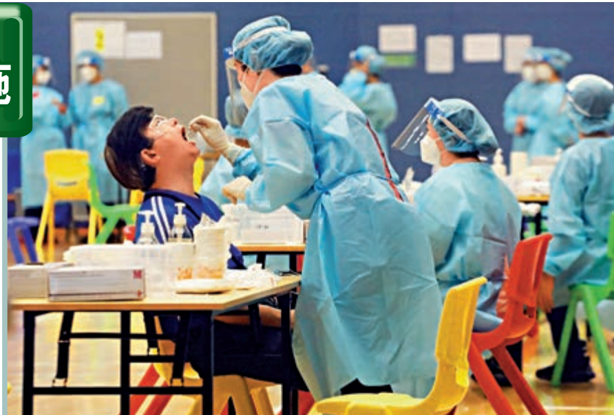
市民在社區檢測中心自費檢測後，如結果呈陰性，可獲檢測機構發出的核酸檢測結果證明

因應「旅遊氣泡」、「健康碼」等計劃即將準備推行，政府經招標設立的四個社區檢測中心，可望於本月中開始運作。行政長官林鄭月娥昨日宣布，每次檢測服務收費低至240元，自費檢測的市民可獲發核酸檢測證明。四個社區檢測中心首階段運作三個月，並視乎情況可再延長三個月，林鄭月娥稱，社區檢測中心服務可為市民日後出行提供方便，若市民需要更方便或更便宜的檢測服務，政府一定會爭取做到。