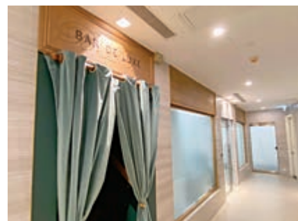
▲昨日新增的一宗源頭不明個案，男患者曾經到雲咸街Bar De Luxe酒吧飲酒

、羈留所人士及工作人員。她引述警方初步調查估計，患者在潛伏期內接觸過數十人，預計未必容易找到他們，現時確認不到有關的風險。