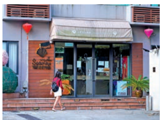
▲「宅度假」群組確診數字不斷增加，部分無參加聚會的人亦受感染