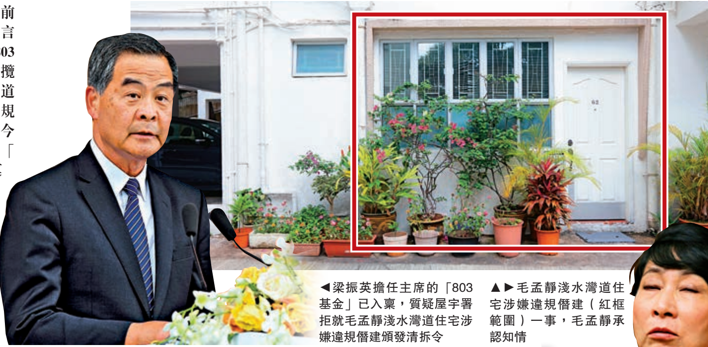
▲梁振英擔任主席的「803基金」已入稟，質疑屋宇署拒就毛孟靜淺水灣道住宅涉嫌違規僭建頒發清拆令

入稟狀透露，申請人已四度就事件與屋宇署交涉，但署方均未能具體回應。申請人質疑屋宇署延誤執法，損害公眾利益，遂入稟提出司法覆核，要求法庭頒令推翻屋宇署拒頒清拆令的決定，以及發還給屋宇署重新考慮是否對涉違規僭建執法；申請人又指，法庭亦可頒令要求屋宇署就兩個停車位被違規僭建採取執法行動。