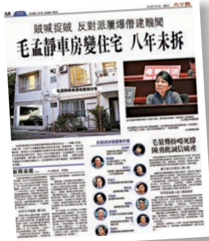
▲毛孟靜對自己寓所僭建一直懶理，《大公報》在2018年及今年曾多次報道事件