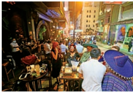
▲剛過去的萬聖節周末，中環蘭桂坊酒吧區人山人海，增加播疫風險

面，業界承諾配合檢測。檢測承辦商Prenetics將於明日起連續兩星期，主動到訪各酒吧及酒館進行檢測。檢測車也會再出動，明日起連續兩星期的星期五至星期日晚上，停泊在酒吧區向顧客派樽，明日起三日分別停泊在中環雲咸街中央廣場附近、尖沙咀金巴利道25號附近、灣仔駱克道88號附近。下周五至日分別停泊堅尼地城麥核士街38至40號附近、旺角西洋菜南街兆萬中心附近、中環士丹頓街36號附近。