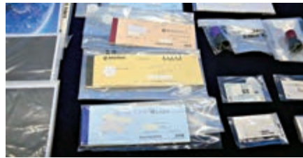
▲警方在涉案公司檢獲批文件

東。商業罪案調查科總督察陸振中表示，本年中開始接報，指一間本地公司（下稱公司A）借用與一間上市公司的合作關係，宣傳實體黃金租賃計劃。在該個投資計劃中，公司A安排受害人購買的金條以每公斤計算，每條約30萬港元，受害人檢視買入的金條後，由公司A接管，聲稱租借給上市公司。受害人可獲每月定期派息，在租約期滿後取回本金，可獲得6.6%至7.5%年利率的保證利息回報。但當受害人將金條交約公司A保管後，只有部分人收到回報，租約期滿後全部受害人均未能取回本金和金條，在本年初公司A結業，受害人始知受騙報警。