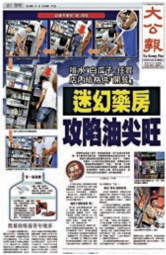
▲《大公報》本月一日獨家報道有藥房違規出售需醫生處方的「白瓜子」、咳藥水等藥物，有關報道引起社會關注