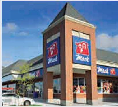
◀ACT在歐美多國的便利店市場佔據領導地位

歐洲，ACT於斯堪的納維亞國家（挪威、瑞典和丹麥）、波羅的海國家（愛沙尼亞、拉脫維亞和立陶宛），以及愛爾蘭則是便利店及道路運輸燃油零售行業中的領導者，並在波蘭佔據着重要地位。此外，ACT在特許權協議下於亞太區（包括香港）、中美洲及中東的其他15個國家和地區以「Circle K」品牌經營近2350家店舖。