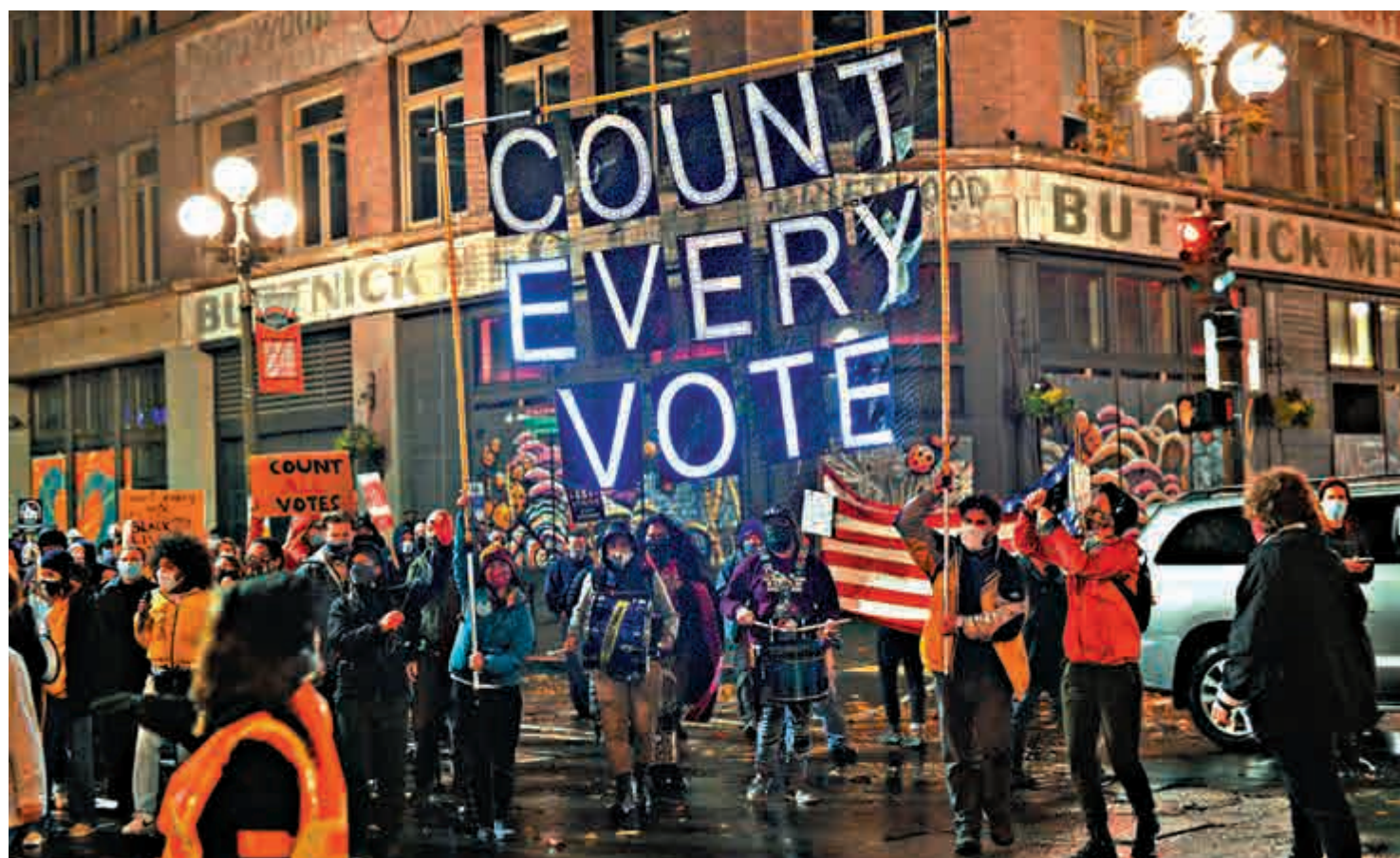
◀今年美國大選頻現爭議，民眾要求「清點每張選票」

【大公報訊】綜合《紐約時報》、《今日美國報》、美國有線電視新聞網報道：美國總統大選並非由一人一票的普選產生，而是各州選舉人團投票選出。原則上選舉人應根據所在州份普選結果投票，但歷史上不乏違反原則的「失信選舉人」，只是從未影響過最終結果。不過，今年美國大選選情尤為激烈，現總統特朗普和民主黨候選人拜登互不相讓，若再出現「失信選舉人」，可能真的會對結果造成影響。