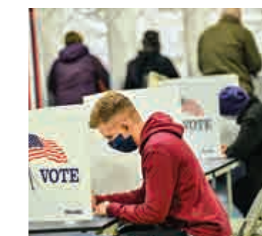
▲新罕布爾州選民3日投出選票

●出現「失信選舉人」大選共發生了四次，以2016年情況最嚴重：其中希拉里一方出現5名「失信選舉人」，特朗普一方出現了兩人。