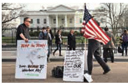
▲反特朗普示威者在白宮前抗議