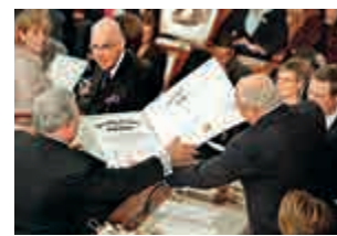
▲2009年1月國會清點選舉人票