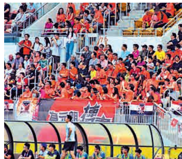
▲球場重開觀眾席，但供佔用座位不得超過座位數目的75% 資料圖片

足總表示，會遵循政府及足總醫藥委員會的條例及建議，於比賽場地實施相應的衛生防疫措施，包括球迷進入比賽場地前需接受體溫檢查及提交健康申報表，並必須於球場範圍內正確佩戴口罩。