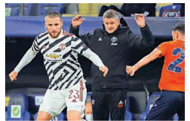
▲曼聯主帥蘇斯克查（中）承認自己的戰術有問題

【大公報訊】綜合ESPN FC、每日郵報報道：英超勁旅曼聯吞下本季歐聯分組賽首敗，昨天凌晨出戰H組作客對陣土耳其球隊巴沙克舒希，沒想到接連犯下業餘程度的失誤而失掉兩球，即使安東尼馬迪爾扳回一城，最終仍以1：2見負。多位名宿如史高斯炮轟主帥蘇斯克查排陣出錯，後者亦承認自己的戰術出了問題，中場球員般奴費南迪斯則力撐球隊，表示輸掉一場賽事不會影響出線形勢。