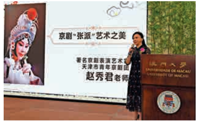
▲京劇表演藝術家趙秀君主講京劇講座