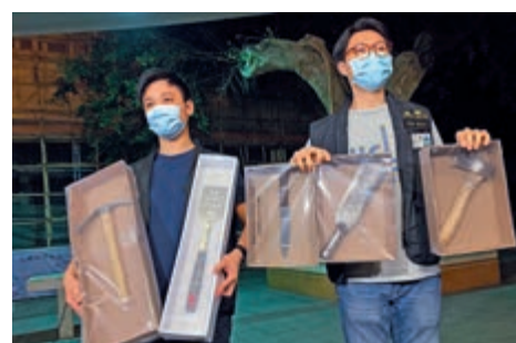
▲警方拘捕一名涉案男子，並展示案中檢獲的一批利器