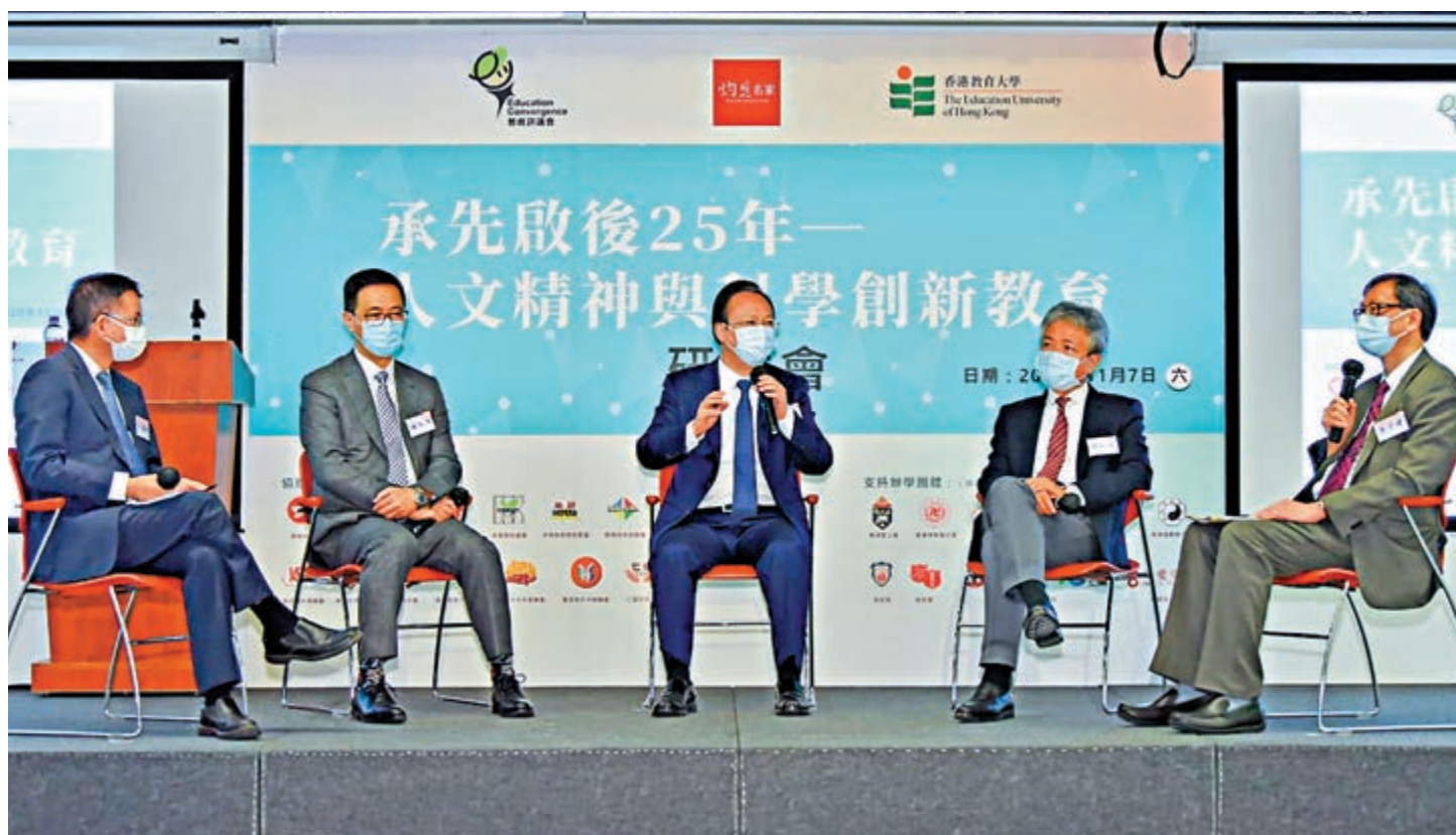
▲中聯辦副主任譚鐵牛（中）在研討會上與在場人士分享，並指出人工智能在教育領域應用日益廣泛，加速教育形態的變革，呼籲促進二者結合

香港教育大學校董會主席馬時亨、校長張仁良、教評會主席何漢權、灼見名家社長文灼非等，以及有關辦學團體、教育社團的60餘位代表參加研討會。