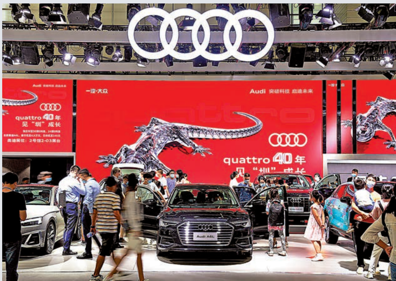
▲10月4日，2020（第十二屆）深圳國際汽車展覽會在深圳會展中心舉辦，本次車展匯聚百個品牌800款新車