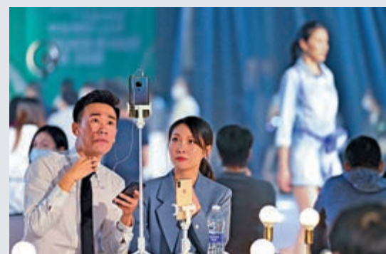
▲10月19日，第128屆廣交會時尚周「時尚爆款LIVE秀」在廣州市廣交會威斯汀酒店舉辦。圖為主播為線上觀眾直播模特走秀

疫情期間，深圳、廣州相繼出保市場主體、保經濟的措施，令到各行各業可以回歸正常運營軌道。