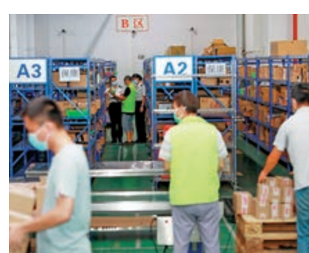
▲珠海保稅區通過港珠澳大橋打造區域性國際物流樞紐，圖為珠海跨境電商查驗現場

基地。近期澳門青年創業項目「想要城跨境電商孵化基地」便落地，立足為澳門商戶發展跨境電商業務提供一系列專業服務，支持更多澳資企業孵化落戶。同時，珠海保稅區全力推動橫琴自貿區對澳合作的「延伸拓展區」，從珠澳產業合作、人才流動、服務配套等領域助建「粵澳深度合作區」。