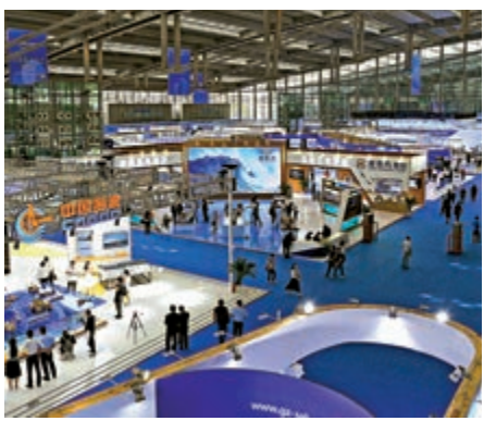
▲10月15日，2020中國海洋經濟博覽會在深圳會展中心舉辦

」相互促進，讓灣區的國內大循環目標得以實現。而在此大格局中，無疑需要進一步發揮深圳和廣州的領頭羊作用，從而為整個大灣區經濟的進一步恢復注入新動力和活力。