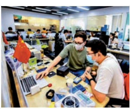
▲位於深港科技創新合作區內的研發團隊

已有合作項目落地。去年10月，深港科技創新合作區的深港國際科技園、國際生物醫藥產業園、國際量子研究中心等深圳5大園區正式對外開園，來自香