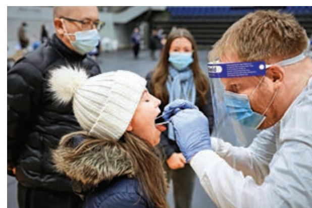
▲ 丹麥醫療人員正在進行新冠病毒檢測

因應丹麥水貂養殖場廣泛爆發，英國已停止把丹麥列入其入境豁免名單中，又禁止過去14天曾前往丹麥的貨車司機和非英國居民進入英國。根據8日凌晨4時生效的新規定，從丹麥啟程的客機和船，還有它們所運載的貨物，都不獲准停泊。