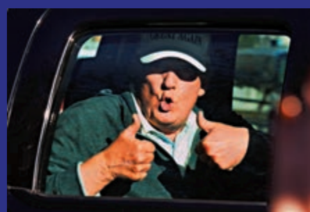
◀ 特朗普7日離開高爾夫球場時向其支持者豎拇指

【大公報訊】綜合法新社、《紐約時報》、《每日郵報》報道：美國多間傳媒宣布拜登勝選，特朗普的私人律師朱利亞尼9日表示，總統特朗普不接受美國大選結果，揚言將在10州發起訴訟，但即使是特朗普的顧問都直言勝算不大。敗選後的特朗普「禍不單行」，大有樹倒猢猻散的態勢，白宮已經開始掀起離職潮；英國媒體稱「第一夫人」梅拉尼婭可能提出離婚；而失去總統保護罩的特朗普，最壞的下場可能是銀鑊入獄。