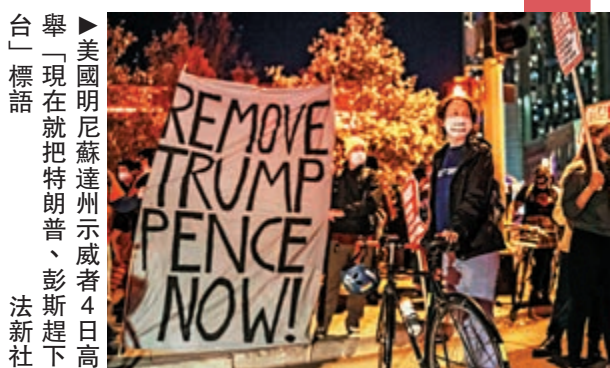
▲ 美國明尼蘇達州示威者4日高舉「現在就把特朗普、彭斯趕下台」標語