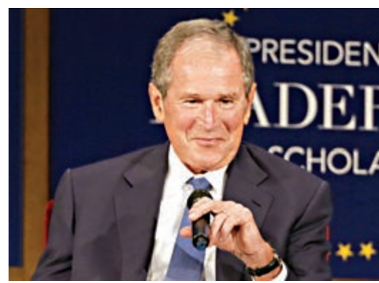
▲ 美國前總統小布什向拜登道賀

另一邊，特朗普的長期盟友、前新澤西州長克萊斯在在接受美國廣播公司採訪時，再次與特朗普割席。他說，「很早就應該對總統（特朗普）說：『如果你不認輸的依據是大選舞弊，那就證明給我們看。』我們不能在沒有證據的情況下，盲目支持你。」