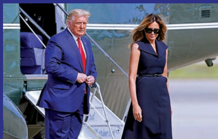
▼ 特朗普和夫人梅拉尼婭前去參加總統辯論