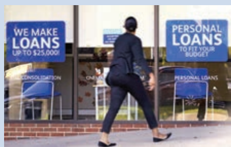
▲田納西州一名女性經過私人借貸處前 資料圖片