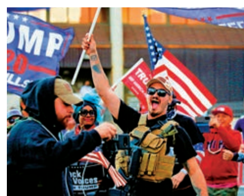
▲8日在亞利桑那州示威的特朗普支持者大多沒有戴口罩

剛剛結束的大選更加劇了病毒的傳播，美國疾控中心允許病毒檢測為陽性的人前往投票站投票，甚至在有票站工作人員因新冠死亡後，對曾到過該票站的民眾不進行追蹤隔離。此外，計票過程中，兩方支持者在街頭集會、示威，播毒風險極高。