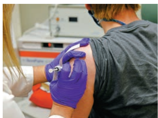
▲志願者今年5月接種輝瑞疫苗

抗疫特別工作小組由12名公共衛生專家組成。美媒發現，小組成員之一的布萊特博士曾在特朗普政府任職公共衛生官員，1月曾就新冠病毒發出警告，由於抵制將經氣噴廣泛作為新冠治療藥物被降職，他今年5月被開除。拜登競選陣營一名資深顧問透露，未來幾