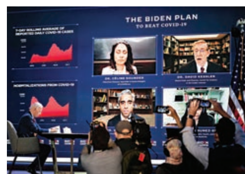
▲拜登上月與默西等專家討論抗疫問題 資料圖片