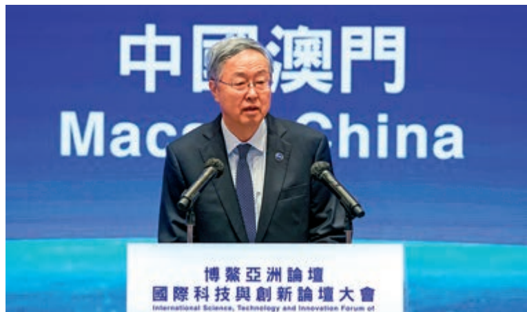
▲周小川相信，推動科技創新與加強科技治理已離不開國際合作