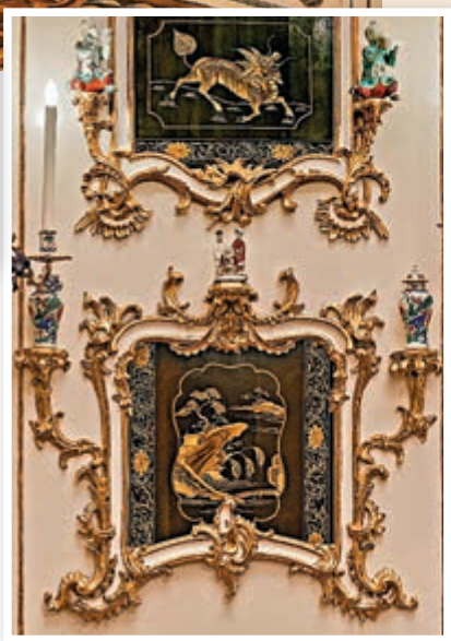
▲廳室內中國風的瓷器和藝術品琳琅滿目