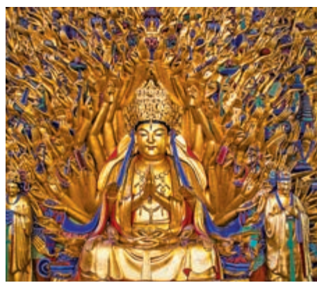
▲大足石刻千手觀音造像

【大公報訊】據中新網報道：歷經千年的文化遺產成了「網紅」景點，文物保護和利用如何平衡？重慶大足石刻造像修復保護智能升級，讓文物「活起來，健康起來」。