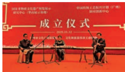
▲成立儀式上，非遺傳承人現場展示技藝

目前，文化和旅游部恭王府博物館與廣州市文化廣電旅遊局已經搭建起「推進戰略合作工作領導小組」組織機構，分為工作委員會和專家委員會兩部分。