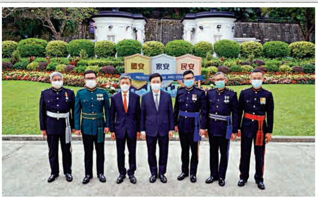
紀律部隊首長與李家超合照

今年有195人獲行政長官社區服務獎狀，253人獲行政長官公共服務獎狀。政府發言人早前表示，今年這兩個獎項的人士特別多，是為了藉此表揚在過去一年處理社會事件和應對新冠疫情表現傑出的人士。