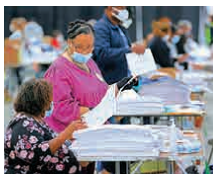
▲佐治亞州票站人員14日重新點算選票

另一方面，在現任總統特朗普的要求下，佐治亞州13日開始重新點算近500萬張選票。這是該州有史以來首次進行全州範圍的重新計票。特朗普與民主黨候選人拜登在佐治亞的得票極為接近，前者僅比後者少0.3%，即1.4萬張票，符合該州重新計票標準。該州159個縣及數千工作人員需在18日前完成計票，並在20日前將最終結果呈交共和黨籍州長肯普。若重新計票後拜登的領先優勢小於0.5個百分點，特朗普可再次要求重新計票。選舉官員預測，重新計票的結果仍將與現有結果類似。