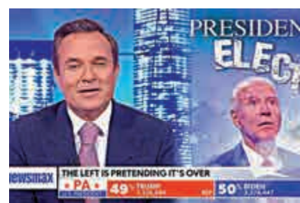
▲Newsmax仍聲稱拜登沒有勝選 網絡圖片

右翼主流媒體霍士新聞一向被視為特朗普支持者，但今年大選期間多次「背叛」，包括搶先宣布拜登在亞利桑那勝出，令特朗普大失所望。12日，特朗普在推特上批評霍士新聞「