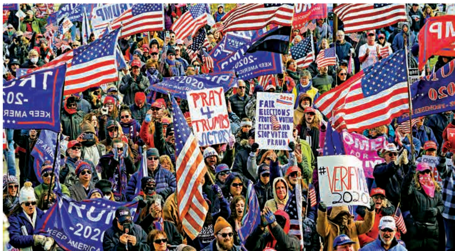
▲14日，華府、密歇根、佛州等多地爆發「特粉」大遊行