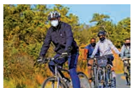
▲拜登與妻子吉爾14日一起踩單車

深顧問克萊因出任白宮幕僚長後，拜登有意委任競選經理狄龍擔任專門負責立法事務的顧問。狄龍是首位成功營運民主黨總統競選工作的女性經理，近來聲名大噪。