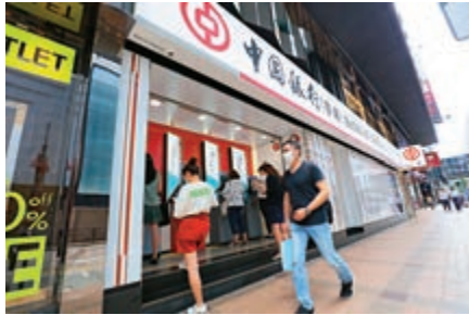
▲分析指，是次中銀下調息率是為爭奪明年首季市場

【大公報訊】市場消息指中銀下調400萬至1000萬元按揭貸款額之利率，由原先的H+1.35%至1.45%，減至H+1.3%，現金回贈亦有所上調。中銀未有回應該消息，但指該行的按揭服務條件，包括按揭息率及現金回贈，會視乎貸款金額、客戶關係等多項因素而定。市場分析指，本港銀行體系結餘再創新高，拆息低企下，料會有銀行跟隨下調按息，以平衡競爭力。