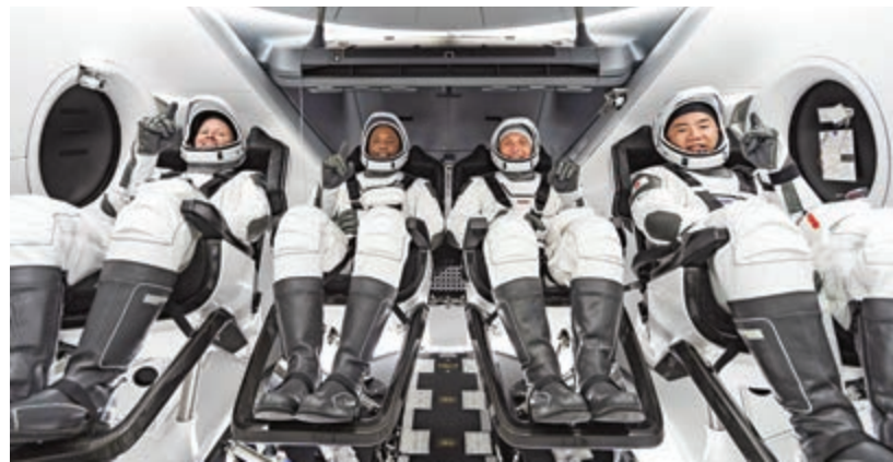
▲龍飛船4名太空人：沃克、格洛弗、霍普金斯、野口宗一（左起）

SpaceX斬獲的項目依賴於新生技術，最初的收入可能有限，但隨着太空項目已成為美國政府的長期戰略，外界預料在未來十年，SpaceX收入大增。