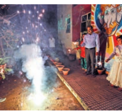
▲印度民眾在排燈節無視禁令放鞭炮

印度每年入冬，包括首都新德里在內的北部地區農民大量焚燒稻梗等廢棄物及工廠、工地廢氣等污染源，加上氣溫下降導致空氣沉降