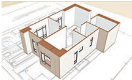
▲家居裝修工程不但報價差異大，有承辦商更只列總價，想要仔細分項報價要先收2000元

【大公報訊】記者關婉鈞報道：消委會發現，雖然家居裝修工程動輒要花上數十萬甚至過百萬元，但不少裝修公司所提供的報價單含糊不清，若超支甚至工期延遲都難以追討，同一個單位的報價可相差一倍有多。消委會表示，會視乎業界是否自律和改善，不排除會向政府建議立法訂立標準合約。