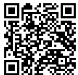
掃一掃， 收聽正音示範

àn tàn）對方：「戲精！」更有新年時，可以說是一場沒有硝煙（xiāo yān）的戰爭了，一手推拒（tuī jù）長輩，嘴上說：「我長大了，當然不能再收您的紅包了！」另一手拉開自己的口袋，眼睛還要緊緊盯着長輩手上的紅包。相信大家都有同感，別人給你準備了一份禮物，顏色或款式（kuǎn shì）並不合你的心意，你卻要裝作非常喜歡的樣子。英國有一家機構做過此類的調查，結果顯示2000名受訪者裏有73%表示節日收到禮物時「表演」驚喜反應已經是家常便飯（jiā cháng biàn fàn），58%的人認為自己已經練了一身演技來應對這種場面。這個機構在做調查的過程中還拍攝了一些有意思的視頻，可以看到10個人中會有8個在收到自己討厭的禮物佯裝（yáng zhuāng）喜歡，只有1個人會坦白說自己不喜歡；也有25%的人認為這是一種禮貌，直白說出來就算是「不懂禮數」，會讓自己和他人沒面子。此外，有17%的耿直（gěng zhí）的男性收到禮物後會選擇給對方一個真實的反饋（fǎn kuì），但只有9%的女性才會這麼做。「禮數」不周也很容易引起不合，平均每九對情侶中就有一對會因為送的禮物而吵架，甚至感