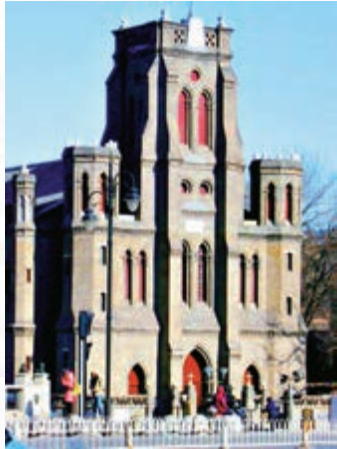
▲始建於1869年的天津望海樓天主堂，經歷兩度燒毀兩度重建，現被國務院列入重點文物保護單位