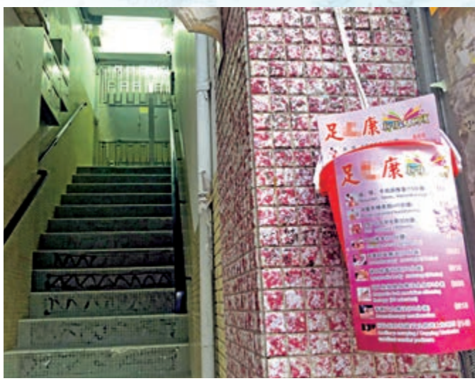
▲鳳姐單位已轉讓給足浴店，唐樓地下擺放「新張大酬賓」宣傳單張

啟源樓處於的積存街多達近十幢唐樓掛上LED閃燈的足浴店招牌，當中最少有八間按摩店，部分是提供色情服務的按摩店，記者觀察所得，不少識途老馬川流不息出入該唐樓。記者向確診鳳寶樓下的打冷店負責人邱先生了解，邱先生說：「知道該單位曾有確診者和「雞寶」，多數都係區外人出入按摩店，區內街坊一定唔會，你估唔驚界街坊認到，而且區內好多人都對確診妓女已議論紛紛。」