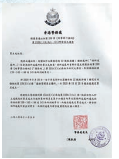
▲玻璃門貼上警方發出的多張通告，確認該單位此前是賣淫場所