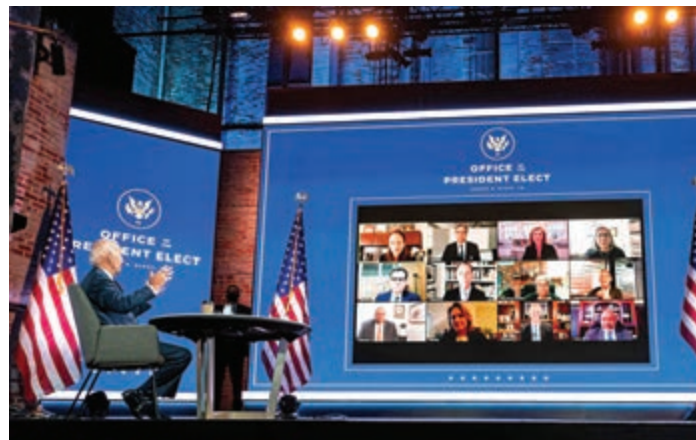
▲美國候任總統拜登17日在特拉華州與助手和專家舉行視像會議

拜登17日在特拉華州與自家團隊的國安專家舉行視像會議，討論美國在外交、國防及情報等領域面臨的挑戰。他又透露，已經與13位外國領導人對話，包括跟總統特朗普關係密切的以色列總理內塔尼亞胡和印度總理莫迪。