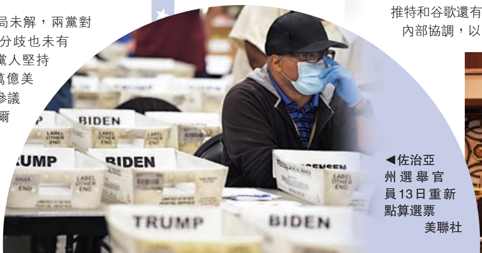
▲佐治亞州選舉官員13日重新點算選票

大選亂局未解，兩黨對紓困計劃的分歧也未有收窄。民主黨人堅持尋求最少2.2萬億美元的紓困方案，參議院共和黨領袖麥康奈爾表示共和黨願意通過5000億美元的小型紓困計劃，但遭到民主黨反對。兩黨互相攻擊對方需為未能通過紓困案負主要責任。