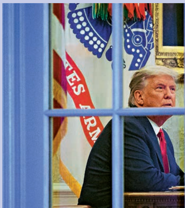
▲美國總統特朗普13日在白宮內準備出席記者會