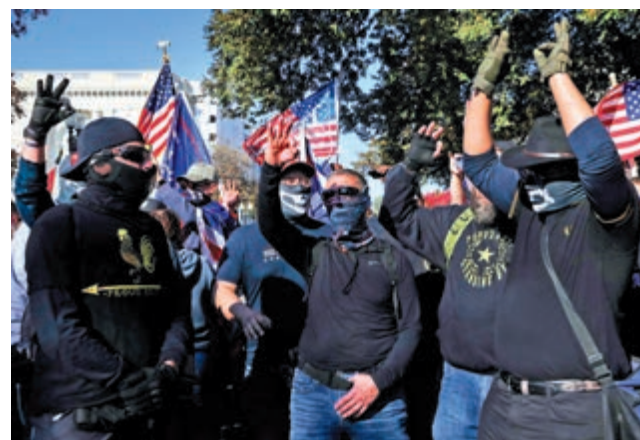
▲支持特朗普的極右團體「驕傲男孩」14日在最高法院前示威

分析指，格雷厄姆「撐持」的舉動反映出共和黨大佬在明年1月佐治亞州參議院最後兩席的結果出爐前，仍需要特朗普「助選」，共和黨無法接受白宮、參眾兩院三輪的結果。參議院共和黨領袖麥康奈爾17日暗示，特朗普的法律訴訟不能再拖，「我們將有序地從這屆政府過渡到下