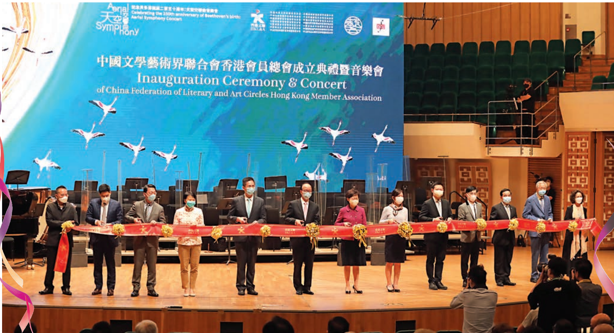
▲主禮嘉賓合照（左起）：林天行、霍啟剛、劉明光、謝凌潔貞、陳百里、馬逢國、林鄭月娥、盧新寧、徐英偉、李秀恒、李海堂、施子清、鄧宛霞