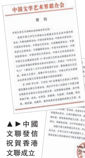
▲中國文聯發信祝賀香港文聯成立

“香港中西文化交匯，需要有这样的文化組織。香港的文化界工作者眾多，但彼此之間不甚密切，香港文聯將大家聯合在一起。作為《國家地理》攝影師，我曾參與內地的攝影比賽，亦出版『帶路』攝影集等，與內地有較多交流，希望通過香港文聯在攝影等藝術範疇上作出貢獻。這次攝影和交響樂結合的音樂會，就是一次新的嘗試。”