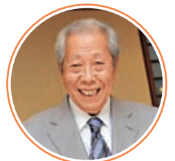
施子清 （中國文聯榮譽委員）

香港文聯於去年註冊，經歷黑暴、疫情，今日得以正式拉開序幕。未來將邀請內地專家來港講授經驗、組織香港訪問團到內地交流，以及舉辦大型演出和一系列社區活動等。”