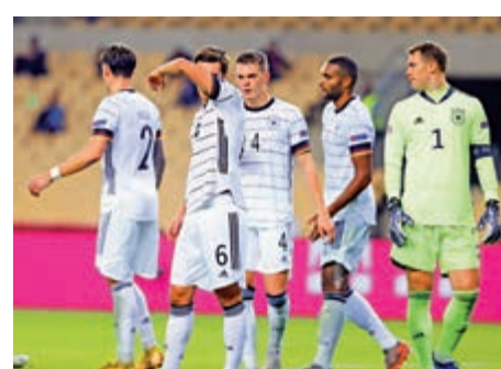
▲德國隊在歐國聯慘敗於西班牙

備的奧沙巴爾臨完場前「埋齋」，取得兩年前主場友賽贏前阿根廷6：1後，與世盃冠軍隊交鋒最大勝仗。托利斯繼葡萄牙的干斯卡奧和英格蘭的奧雲後，第3個在德國腳下連中三元的球員。德國錄得1954年以來最大差距敗績，繼2018世盃分組賽出局後首度丟球。總經理比亞荷夫形容球隊就像2014年世界盃四強以1：7敗於他們的巴西，但仍表示支持主帥路維。