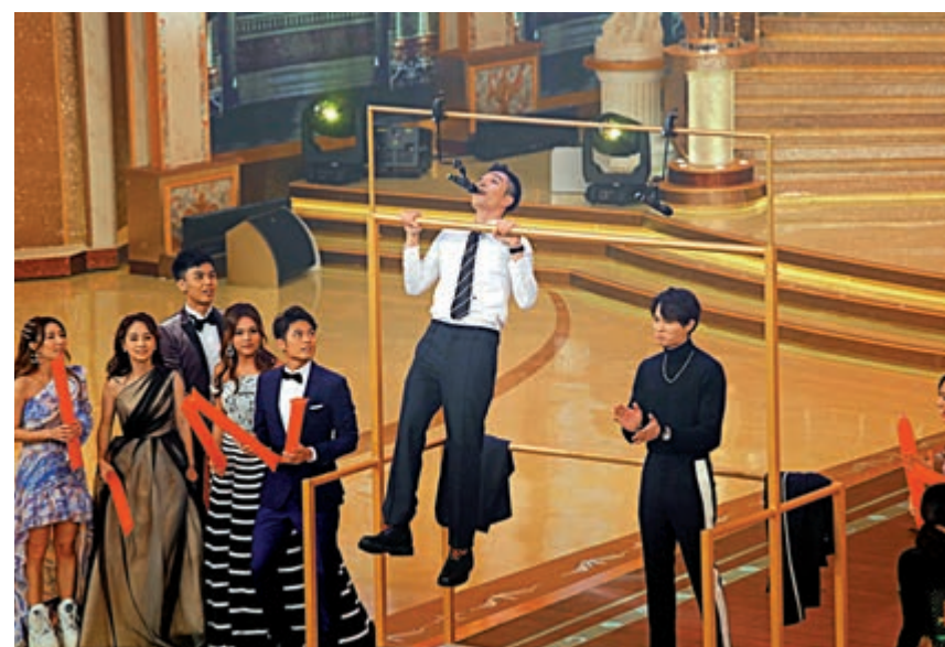
▲周柏豪引體上升時唱歌

昨晚開騷之前，電視城錄影廠設置傳媒中心，傳媒均戴上口罩。外來人士需要過消毒機，現場亦有提供消毒液擦手。