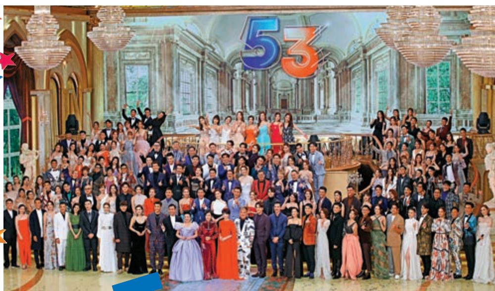
▲節目尾聲，全台藝員盛裝亮相