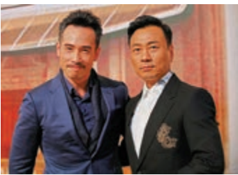
▲陳豪(左)與黎耀祥防疫不敢鬆懈