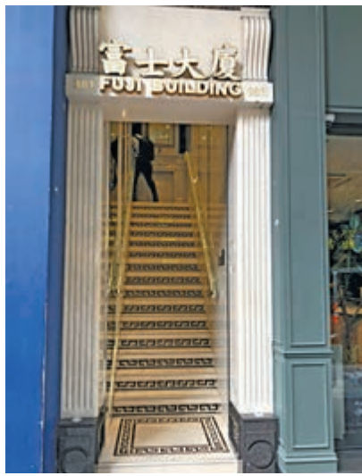
▲富士大廈是本地出名的「鳳廈」

坦言平日在鳳寶內用膳：「就喺呢度，如果個客帶病毒，就算無即時傳播，病毒都可能留嚟屋內。」但她說為方便工作，仍選擇在工作場所內解決三餐。