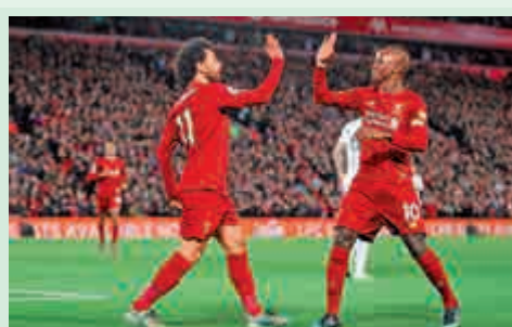
▲穆罕默德沙拿（左）與沙迪奧文尼完美演繹利物浦的高位逼搶戰術