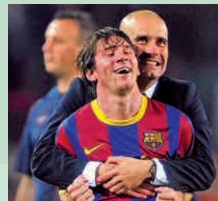
▲哥迪奧拿（後）和美斯在巴塞合作愉快

不過，此戰術講求球員統治中場的能力，像西班牙於2014年世界盃慘敗便與球員狀態下降有關，哥迪奧拿近年在拜仁和曼城雖奪聯賽錦標，但未能複製巴塞的高峰。