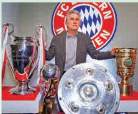
▲拜仁主帥希歷基斯成功領軍場威德甲和歐洲賽場

此外，「得分翼鋒」的另一特色就是踢「錯腳位」，即慣用左腳的球員卻被安排在右路位置，洛賓正是好例子，現在利物浦的穆罕默德沙拿亦是如此。