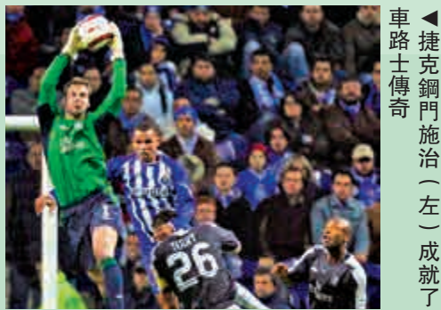
▲捷克鋼門施治（左）成就了車路士傳奇