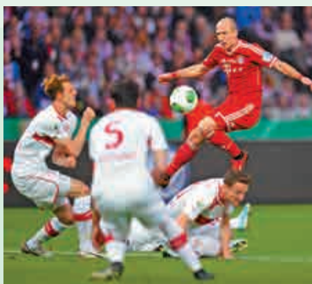
▲洛賓（紅衣）昔日為拜仁比賽的風采，仍令球迷津津樂道