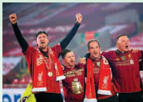
▲高洛普（左）成功帶領利物浦首奪英超錦標