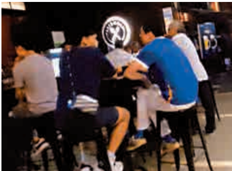
不少酒吧在接近凌晨時分，入座率高逾九成，遠多於政府要求上限

市面有不少室內遊樂場，提供夾公仔（抓娃娃）等娛樂設施，記者在鑽石山一間連鎖室內遊樂場觀察，店方全日派員站在門口，要求入場者量體溫。記者連日觀察，就算周末人流也不多，場