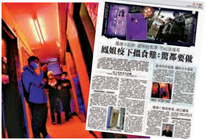
大公報早前報道熱門「鳳廈」之一的建興大廈，鳳寶門外有大批人排隊輪候，防疫情況堪憂