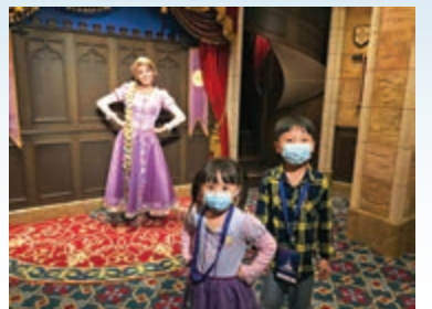
▲大家有機會與長髮公主合照，不過要保持距離