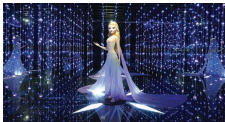
▲《魔雪奇緣》中的Elsa置身魔幻之境