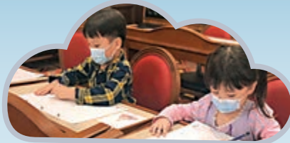
▲小朋友在「動畫藝術教室」跟迪士尼動畫師學習畫城堡