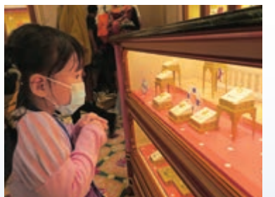
▲「奇妙夢想城堡」內開設的珠寶店