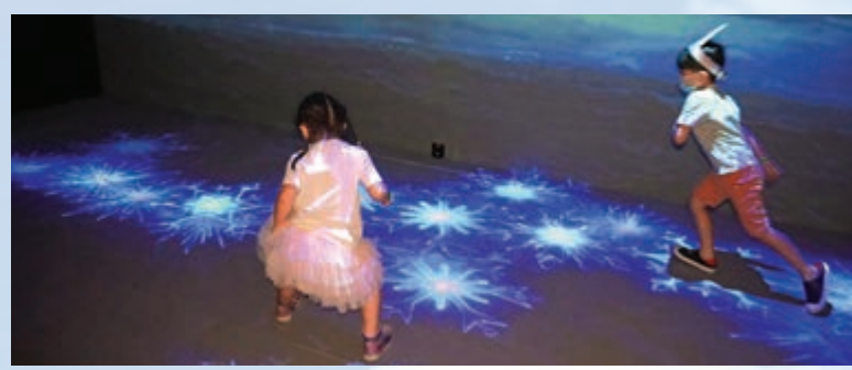
▲小朋友腳踏之處即出現結冰效果，神奇好玩

現場有多個大熱角色以1:1造型示人，過百件官方美術畫稿，包括動畫角色設定及場景設計，讓大家親睹動畫背後最真實的製作場景；更有更多高科技體感互動感應、電影主題音效及炫彩光影特效，異常震撼。