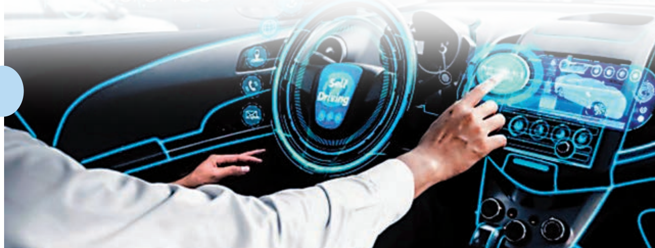
▶中國及美國的汽車人工智能企業前景均告亮麗

汽車人工智能市場到底有多大潛力？從近年各大車企的收購案中便能略知一二。自動駕駛汽車技術公司Cruise Automation只有40名職員，通用汽車在2016年7月出價近10億美元收購。同年，Uber也出價達6.8億美元收購自動駕駛卡車公司Otto，當時這家公司只成立7個月。可以看到美國各大車企正豪擲數億美元，爭搶人工智能領域上的專家人才。如蒙特利爾大學教授Yoshua Bengio所言，市場對人工智能專才的需求，可謂出現爆炸式增長，相比較其他領域的博士、碩士等需求大得多。