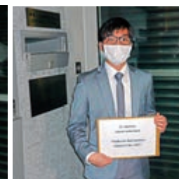
▲華懋、帝國及建灑財團代表