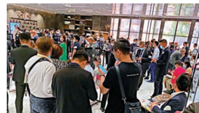
▲本木開賣前收逾1100票，超額15倍。圖為昨晚揀樓情況

由即日起至12月31日，經中原購入首5名買家，可獲贈最多8萬元傢俬置業優惠；同系馬鞍山迎海系列，上載新銷售安排，共推出9伙包括5伙複式特色戶招標。建滔化工（00148）沙田九肚駿嶺薈，亦上載新銷售安排，推出3座洋房招標，招標期由下月1日至明年1月30日。五礦地產（00230）旗下油塘蔚藍東岸，今首推279伙。據公布，項目收4927票。