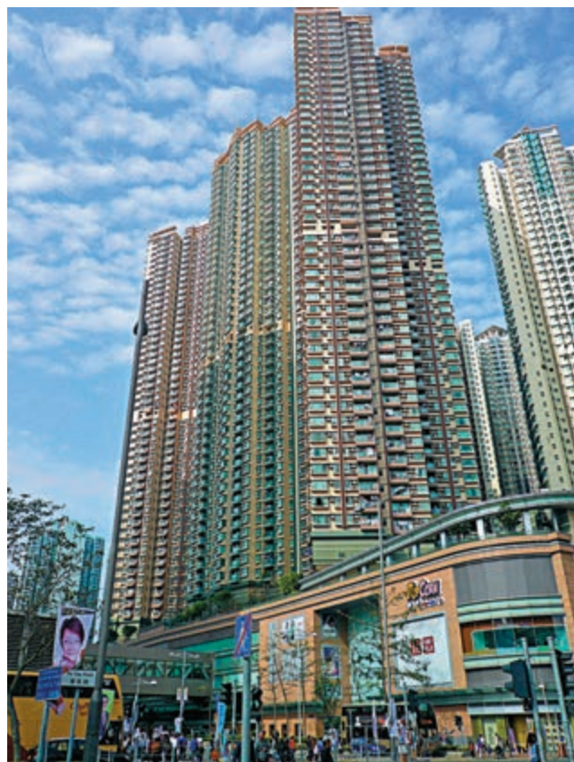
▲君傲灣有業主將去年底買入的辣招盤易手，大蝕170萬離場