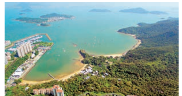
▲「明日大嶼」可為香港提供十五萬至二十六萬個住宅單位，創造約二十萬個就業機會

政務司司長張建宗說，「明日大嶼」計劃是本港非常重要的基建項目，會發展作第三個核心商業區，提供工作及住宅，解決土地供應問題。他指出，此項目是解決本港長期缺地問題的容易及快捷方法，當局將來可以賣地，所投放的資金是投資而非白白浪費。