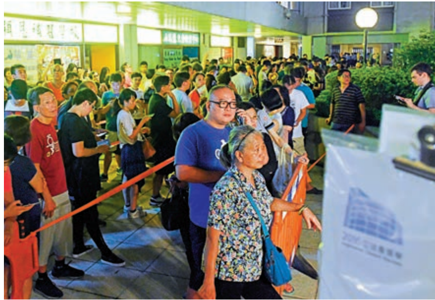
▲政府正積極研究實施境外投票的可行性。圖為2016年立法會選舉市民排隊投票情況

政制及內地事務局局長曾國衛昨日在施政報告相關措施記者會上強調，特區政府會根據全國人大常委會的釋法內容和相關決定，盡快就基本法第104條，有關宣誓的解釋進行本地法例修訂工作。他亦指出，特區政府正積極研究《選管會報告》提出的境外投票安排、引入使用電子選民登記冊、安排有需要人士優先領取選票等建議，制訂可行方案後諮詢立法會意見，以完善現有選舉安排。