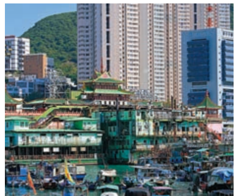
▲珍寶海鮮舫活化後，不會只維持做酒樓，會研究如何配合整個南區發展

【大公報訊】記者關據鈞、吳嘉鈴報導：施政報告中「躍動港島南」計劃，海洋公園及躍動港島南計劃會注入新元素，推動海洋公園與珍寶海鮮舫能夠互相補足，期望助公園「重生」，帶動整個南區發展。商務及經濟發展局局長邱騰華27日在新一份施政報告相關措施記者會上表示，制定經貿策略時要「兩條腿走路」，既