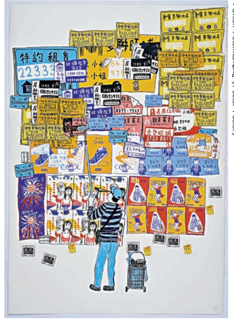
Onion Peleman作品《Poster Poster》