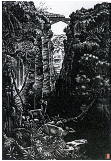
梁永泰版畫作品《從前沒有人到過的地方》