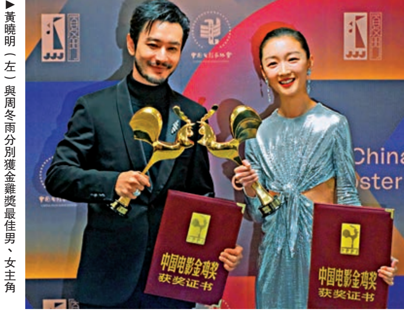
黃曉明（左）與周冬雨分別獲金雞獎最佳男、女主角

在那個需要寫信才能傳遞消息的年代，香港傳統印藝師傅操控着印刷機、通過「執字粒」出版刊物和書籍。而由此衍生的版畫藝術，早在一九三〇年代由南來的藝術家將其引入香港。時代發展如何影響印刷術、版畫發展？香港文化博物館現正舉行「字裡圖間——香港印藝傳奇」及「20/20香港版畫圖像藝術展」兩個展覽，前者展示香港活字印刷及平版石印舊時光，後者以二十組藝術品反映本地版畫藝術風貌。