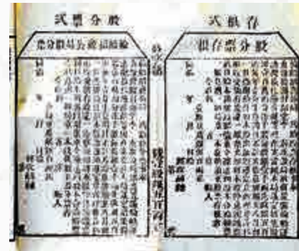
▲清同治時期的招商局股票 ▼戰後初期（1948年）的招商局股票