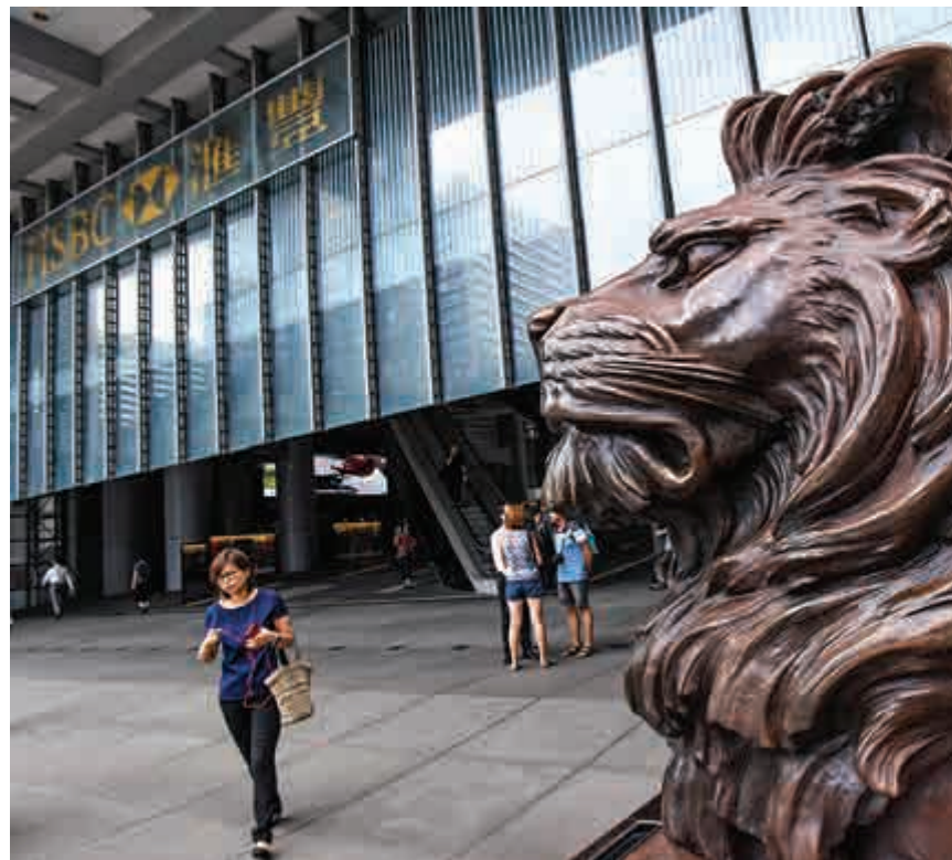
▲滙豐控股昨日跌幅超過百分之一點一，相信與歐央行對銀行派息禁令可能進一步延長有關

十一月股市較十月升二二三點四，表現仍然出色。展望十二月份，好友要守二六〇〇〇，並圖再挑戰二七〇〇〇關，若能辦到，反覆向好之勢可望持續。